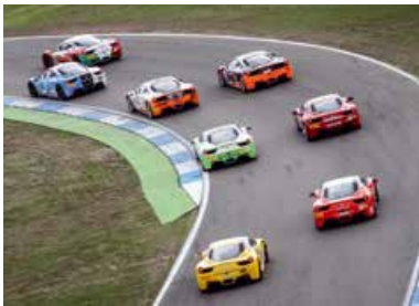
Ferrari Racing Days