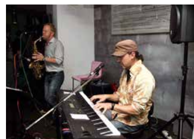
Hockenheimer Nacht der Musik - Duo Hey Babe