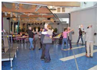
Kerwefrühshoppen Traditioneller Frühshoppen