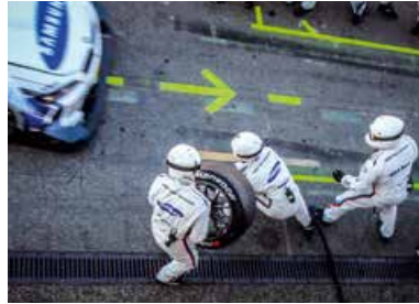
DTM Finale Boxenstopp