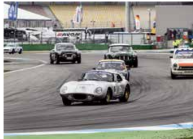
Bosch Hockenheim Historic