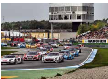
ADAC GT MASTERS