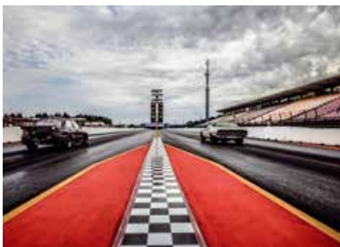
Public Race Days