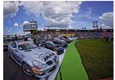
High Performance Days