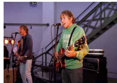
Hockenheimer Nacht der Musik - Used