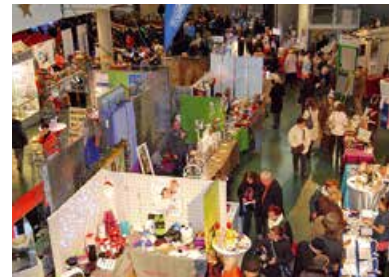
Hockenheimer Advent Der 23. Weihnachtsmarkt