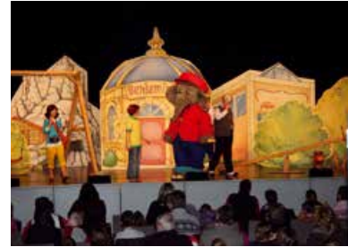
Benjamin Blümchen Die elefantastische Show