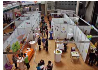
Messestände beim 9. Hockenheimer Ausbildungstag mit 48 Ausstellern