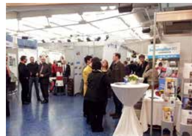
Neujahrsempfang Mit Präsentationsständen der Vereine