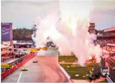
DTM Finale Zieleinfahrt