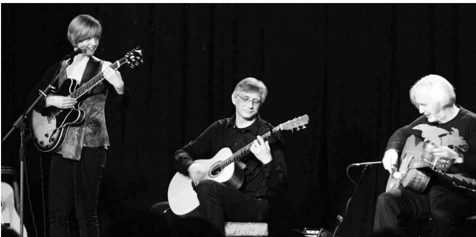
Wiederholt im Pumpwerk zu Gast: Weltklassegitarrist Claus Boesser-Ferrari.

Die wirtschaftliche Bilanz des Pumpwerks ist 2009 durchwachsen. Die Auswirkungen der Wirtschaftskrise und das dadurch veränderte Ausgehverhalten führten zu einem Besucherrückgang. Das Pumpwerk konzentriert sich deshalb auf die Säulen seiner Kulturarbeit: Kontinuität in der Qualität des Kulturprogramms, professionelles Ambiente und die Bereitschaft, neue Akzente zu setzen.