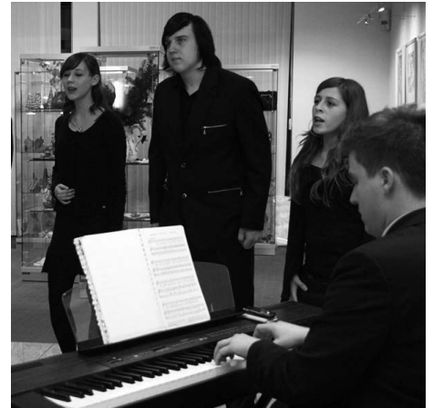
Die Ausstellungseröffnung „Kreatives Arbeiten“ der VHS wurde von der Musikschule umrahmt.

Neu im Angebot waren Vorträge zum Beispiel über die aktuellen Themen „Neuregelung der Erbschaftssteuer“ oder „Elternunterhalt, Sozialhilferegress und Schenkungsrückforderungen bei Heimunterbringung pflegebedürftiger Angehöriger“. Die seit vielen Jahren bestehende Zusammenarbeit mit dem Verein für Heimatgeschichte Hockenheim konnte ebenfalls erfolgreich fortgesetzt werden. Vortragsveranstaltungen in Zusammenarbeit mit