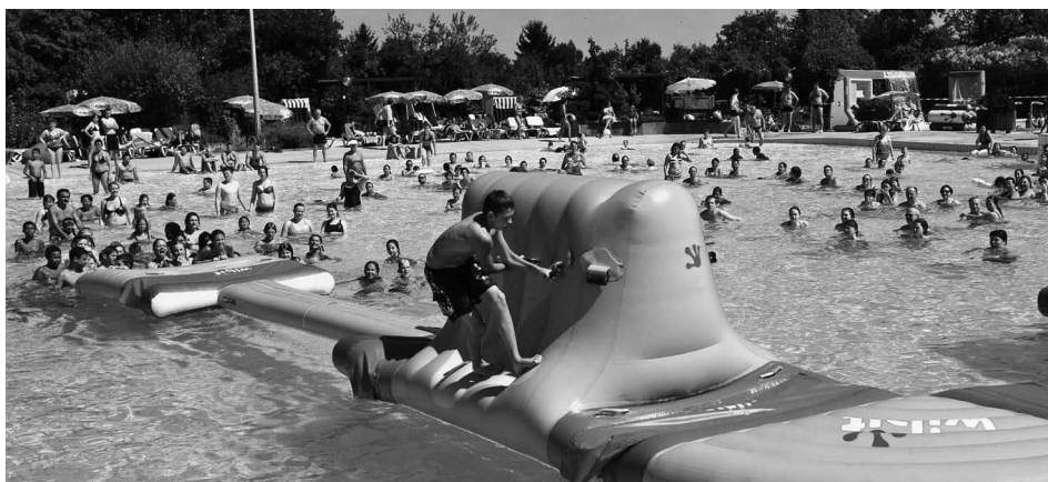
Die Fun-and-Action-Poolparty ist fester Bestandteil des Sommerferienprogramms im Aquadrom. Mit ihm wurde die Freibadsaison zu einem bleibenden Erlebnis.

Zum wiederholten Mal konnte man hinter die Kulissen des Freizeitbades sehen. Von dieser Abendveranstaltung mit fast zweistündiger Führung und vorheriger theoretischer Einführung nahmen die Teilnehmer die Erkenntnis mit, dass das Aquadrom nur mit einem enormen technischen Aufwand reibungslos und zur Zufriedenheit der Gäste betrieben werden kann.