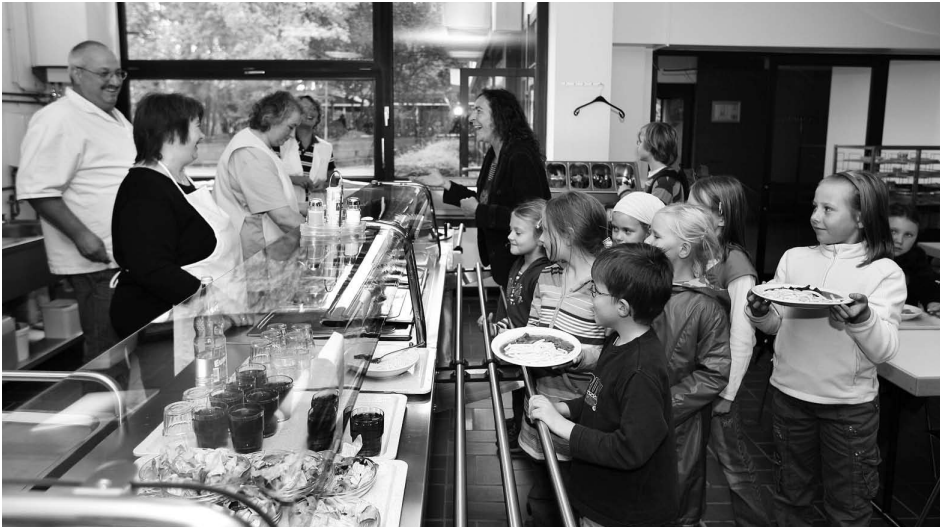
Nach dem Neustart der Schülersmense haben die Schülerinnen und Schüler Appetit und freuen sich sichtlich auf das vom Caterer Diehm und seinem Team frisch zubereitete Essen.