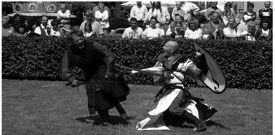
Der „Erste Ochheimer Mittelaltermarkt“ entführte die Besucher mit einem Ritterturnier, Heerlager, Marktspielen und Kinderprogramm auf eine historische Zeitreise in die Vergangenheit.

Nach dem Pflanzen des Sommerflors lagen die Hauptaktivitäten der Parkanlagen GmbH in der Vorbereitung des ersten Mittelalterlichen Marktes, dem „Ochinheimer Mittelaltermarkt“. In Zusammen-