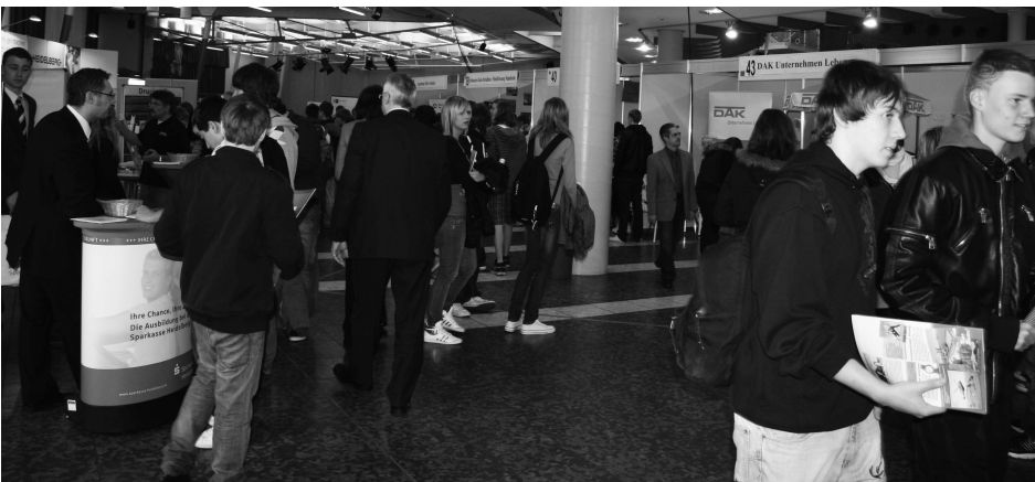
Reges Interesse beim 5. Hockenheimer Ausbildungstag

Die Stadt nimmt diesen wichtigen gesellschaftlichen Auftrag wahr und hatte daher am 2. April rund 800 Schülerinnen und Schüler aus Hockenheim, Altlußheim, Neuußheim und Reilingen zum „5. Hockenheimer Ausbildungstag“ in die Stadthalle eingeladen, um ihnen Hilfestellung zu geben.