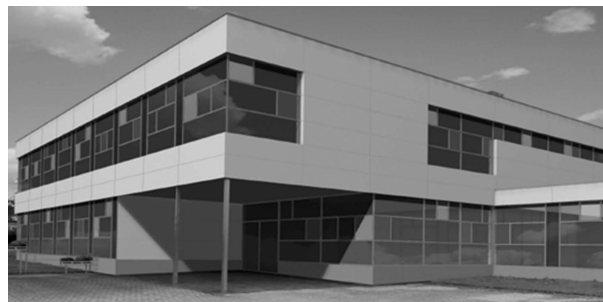
Fassadensanierung an der Hubäcker-Schule

Die Gesamtkosten aller Maßnahmen sind mit 100.000 Euro veranschlagt.