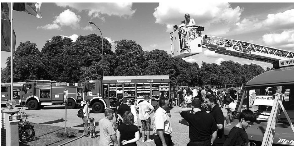
Bei den Tagen der „offenen Tür“ aus Anlass der umgestalteten Feuerwache herrschte großer Besucherandrang. Für die Gäste gab es viele Informationen und Mitmachaktionen.

Mit Hilfe einer Spende der EnBW Kernkraft GmbH konnte ein neuer Firetrainer angeschafft werden. Dieser wird mit einer Gasflamme betrieben, die mit einem Wasserlöscher abgelöscht wird. Somit entfällt das bisherige Befüllen der Feuerlöscher mit Löschpulver. Dies stellt auch einen Beitrag zum Umweltschutz dar, da kein salziges Löschpulver in den Boden gelangt. Der Firetrainer steht allen vier Wehren der Verwaltungsgemeinschaft zur Verfügung und ist eine Investition in den vorbeugenden Brandschutz, da die richtige Bedienung eines Feuerlöschers im Ernstfall Leben retten kann.