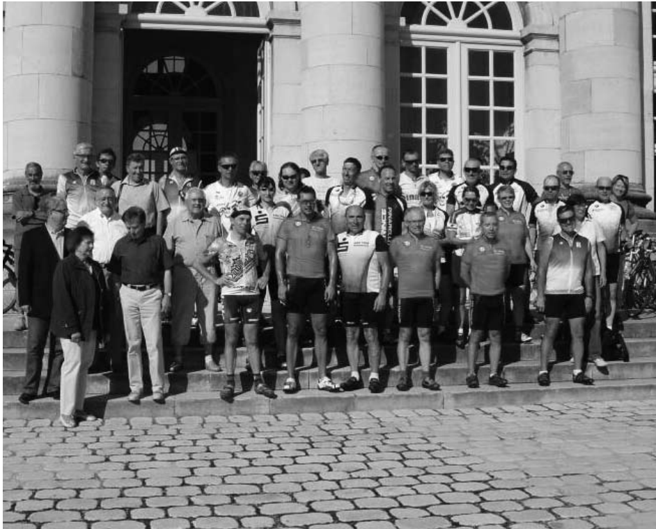
Bei der 20. Auflage ihrer Radfahrt nach Commercy wurden die Sportler der ASG „Triathlon“ und Vertreter beider Freundeskreise von Bürgermeister Muller empfangen.

Beim Rückblick auf die Städtepartnerschaft mit Commercy ist auch für das Jahr 2009 eine durchweg positive Bilanz zu ziehen. Rund 25 Treffen und Veranstaltungen fanden auf offizieller sowie Schul- und Vereinsebene statt, sodass in der Tat von einer lebendigen Verbindung gesprochen werden kann.