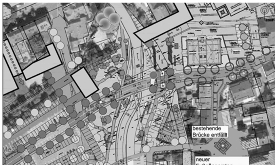
Geplante Maßnahmen zum Hochwasserschutz

heim zu. Mit den in den Jahren 2011 und 2012 geplanten Maßnahmen sind Gesamt-