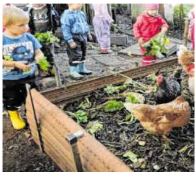
Die Parkgruppe lernt viel über Hühner und andere Tiere.

Die „Waldgruppe“ erzählte bei der Präsentation vom Bau einer Höhle, dem Besuch des Försters, von Pilzen, von Spielen und Basteleien mit Naturmaterialien. Dabei entstanden selbst gebastelte Ängeln, Pfeile und Bögen. Die „Parkgruppe“ berichtete von verschiedenen Tieren im Park und wie diese sich auf