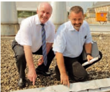
Auf dem Dach der Stadthalle

In einem ersten Bauabschnitt erfolgte für 140.000 Euro die Sanierung von knapp der Hälfte der 780 Quadratmeter Gesamtdachfläche. Im Bereich über dem Foyer, dem kleinen Saal und teils des großen Saals wurden insgesamt fünf Stellen in der Abdichtungsfolie lokalisiert, durch die Wasser eintrat und die es nun nach 25 Jahren Haltbarkeit zu erneuern galt. Nach der Errichtung von Absturz- und Durchsturzsicherungen mussten erst die vorhandenen Solarzellen demontiert werden, bevor der Gründachaufbau entfernt und der Kies abgesaugt werden konnte, um an die eigentliche Folie zu gelangen.