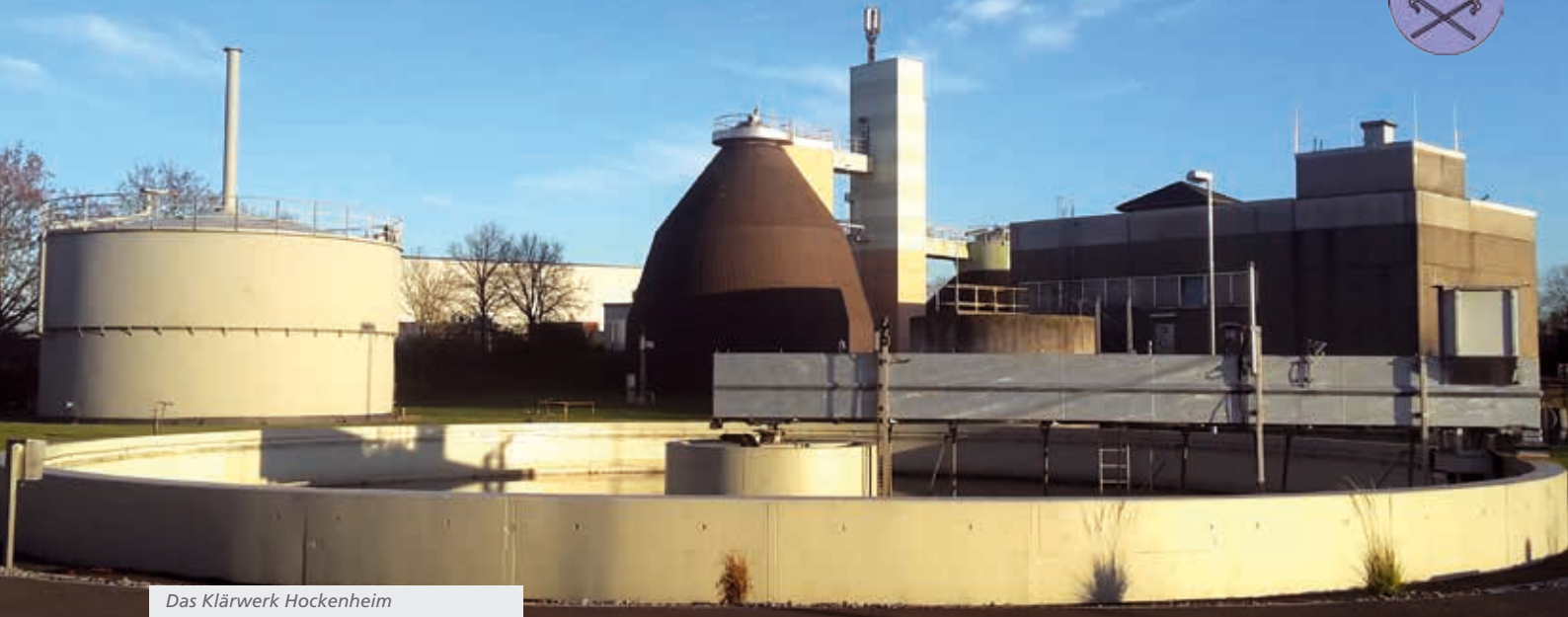
Das Klärwerk Hockenheim