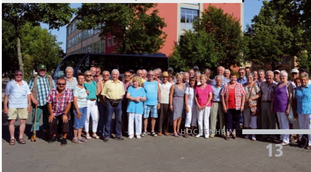
Geballtes Wissen - Pensionäre der Stadtverwaltung in Landau

Einige Wochen später brachen auch rund 70 Pensionäre der Stadtverwaltung in die Garnisons-, Universitäts- und Messestadt Landau auf. Bei schweißtreibenden knapp 40 Grad Celsius wurden beim Pensionärsausflug die historische Altstadt und die kühleren Fort- und Minengänge erkundet.