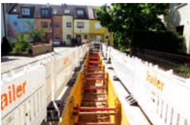
Sanierung schreitet voran

Die Stadtwerke Hockenheim erneuerten 2015 über eine Strecke von 1.300 Metern Gas- und Wasserhauptleitungen sowie die dazugehörigen Hausanschlüsse.