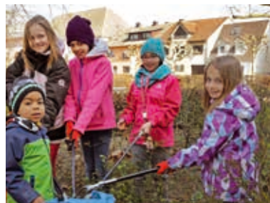
Kinder nehmen am Dreck-weg-Tag teil

Die Anstöße aus der Geschichte wurden im Südstadtkindergarten durch Aktionen wie Müll sammeln beim 5. Dreck-weg-Tag oder dem Bau von Osterkörnchen aus Tetrapak umgesetzt. Die dabei behandelten