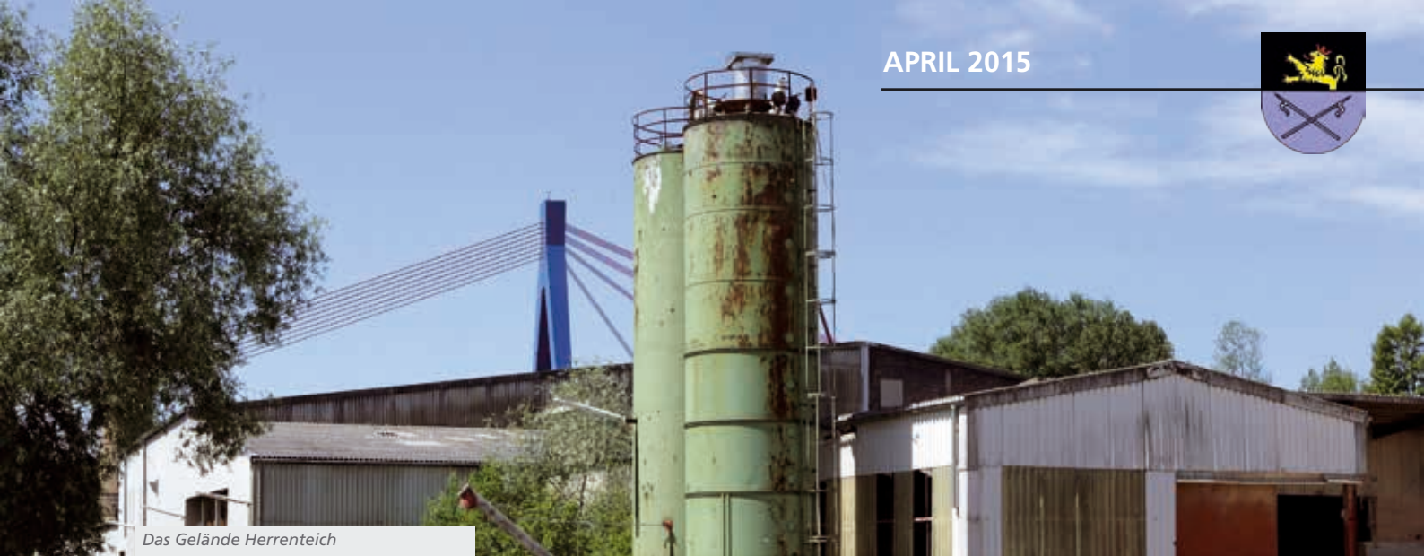
Das Gelände Herrenteich