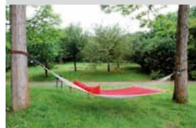
Hängematte im Park

Im GartenschauPark gibt es seit diesem Sommer eine Grillstelle für Jugendliche, die die Stadtverwaltung mit dem Jugendgemeinderat realisiert hat. Außerdem konnten die Besucher von Juli bis September in Hängematten am Robinienhügel ihre Seele baumeln lassen. Trotz Schäden wegen Vandalismus soll dieses Angebot 2016 wiederholt werden.