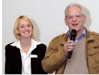
Einsatz für Flüchtlinge

Um das Landratsamt bei der Bewältigung dieser Herausforderung zu unterstützen, veranstaltete die Stadtverwaltung Mitte März und Mitte April zwei Informationsabende mit dem Titel „Willkommen und ankommen in Hockenheim“. Die