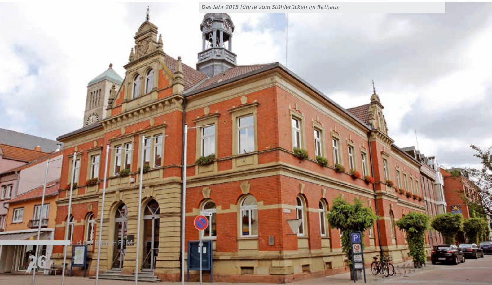
Das Jahr 2015 führte zum Stühlerücken im Rathaus

Die Nachfolge wurde durch internes und externes Personal besetzt. In diesem Zusammenhang erarbeitet die Stadt Hockenheim Maßnahmen und Konzepte im Bereich der Personalbeschaffung, der Personal- und Führungskräfteentwicklung sowie der Ausbildung, um sich im Wettbewerb des öffentlichen Dienstes als attraktiver Arbeitgeber darzustellen.