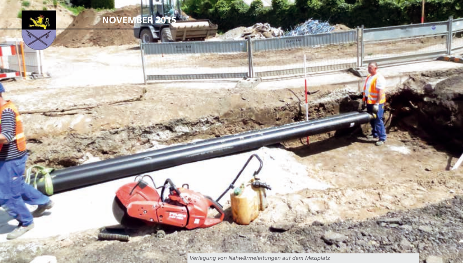
Verlegung von Nahwärmeleitungen auf dem Messplatz