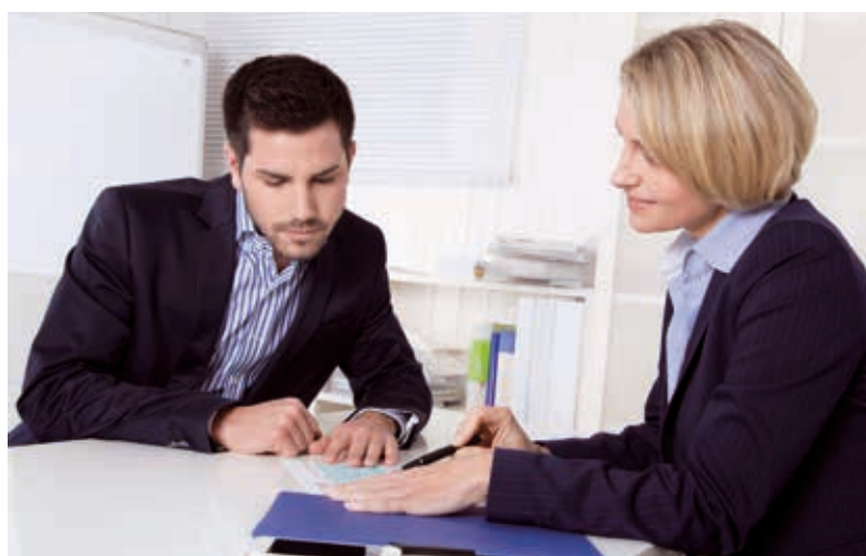
Zweite Mitarbeiterbefragung brachte neue Erkenntnisse

Dieser kontinuierliche Verbesserungsprozess kann allerdings nur gemeinsam mit den Mitarbeitern der Stadt Hockenheim gelingen. „Dass Ihnen die Weiterentwicklung der Stadt Hockenheim am Herzen liegt,