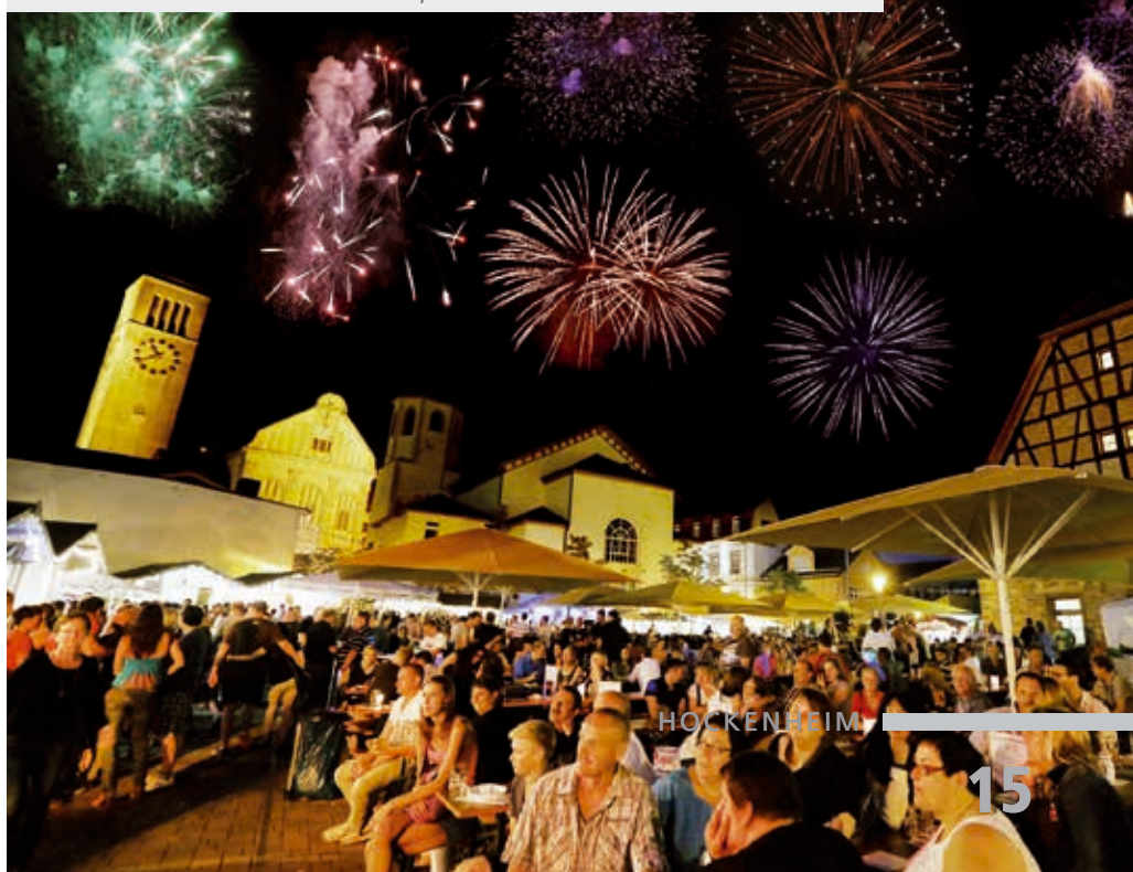
Jubiläums-Feuerwerk über Zehntscheunenplatz

Dies wurde mit einem abwechslungsreichen Bühnenprogramm und einem großen Feuerwerk über dem Zehntscheunenplatz ausgiebig gefeiert. Das traditionelle Straßenfest lud mit toller Live-Musik, abwechslungsreichem Bühnenprogramm sowie zahlreichen Ständen zum Bummeln im Maidorf am Freitag und am Straßenfest in der Hockheimer Innenstadt am Samstag ein.