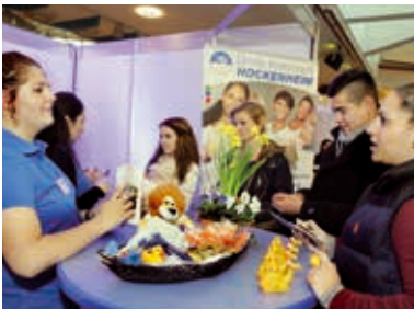
Im Gespräch mit Fachkräften von morgen

Für dreizehn Schulabgänger hat Anfang September mit dem Start der Ausbildung bei der Stadt Hockenheim ein neuer Lebensabschnitt begonnen.