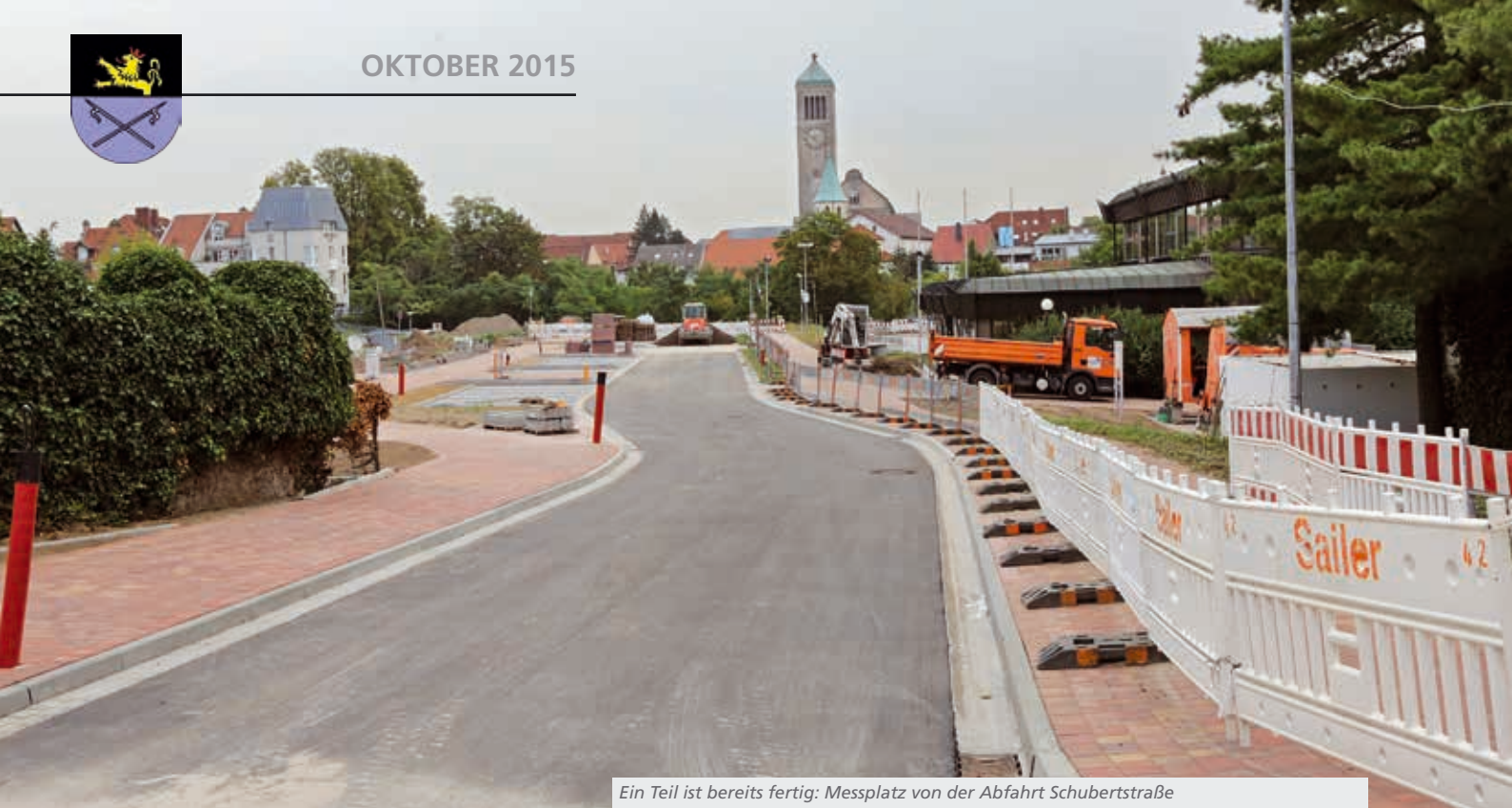
Ein Teil ist bereits fertig: Messplatz von der Abfahrt Schubertstraße