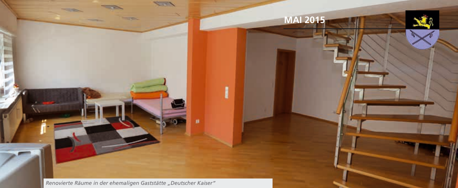
Renovierte Räume in der ehemaligen Gaststätte „Deutscher Kaiser“