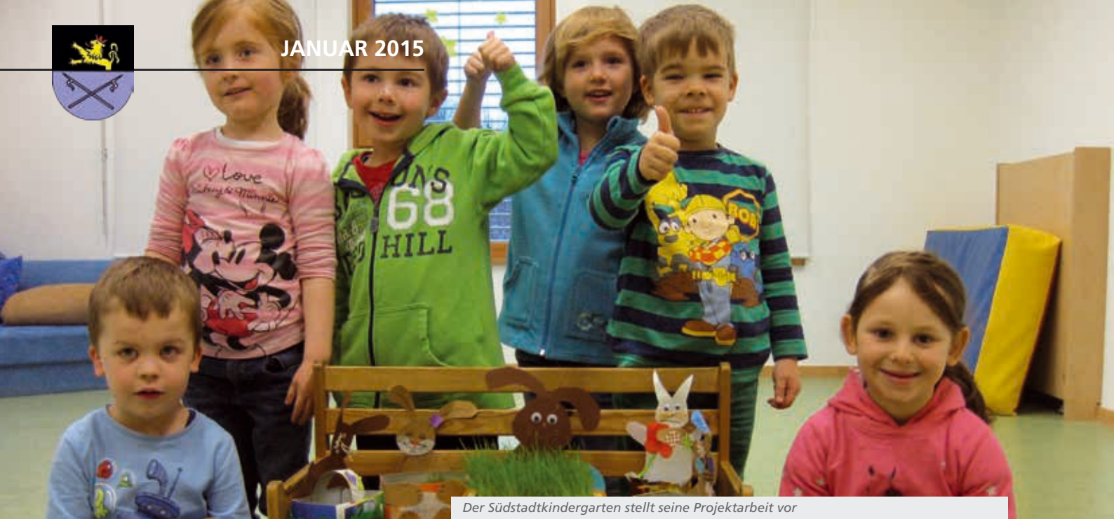
Der Südstadtkindergarten stellt seine Projektarbeit vor