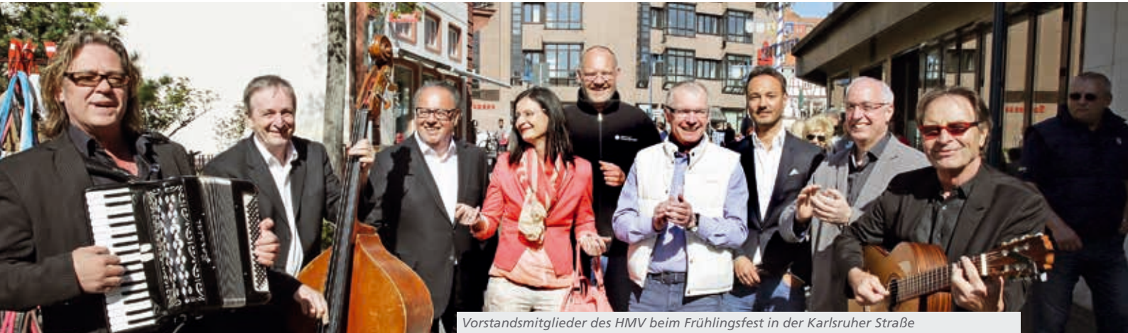
Vorstandsmitglieder des HMV beim Frühlingsfest in der Karlsruher Straße

Als am Montagabend, dem 30. September, im kleinen Saal der Stadthalle Beifall aufbrandete, endete eine fünfjährige Diskussions- und Vorbereitungsphase. 82 Gründungsmitglieder hoben mit ihrem einstimmigen Votum zur Satzung den Hockenheimer Marketing Verein (HMV) aus der Taufe.