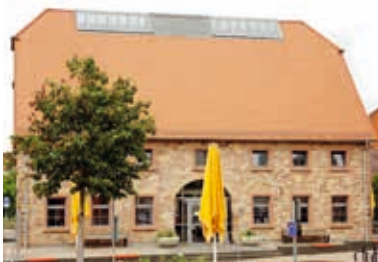
Ort der Begegnung: Die Stadtbibliothek