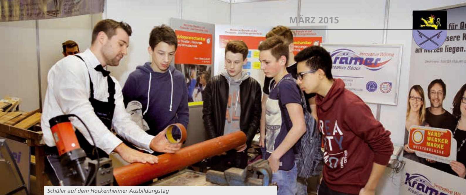
Schüler auf dem Hockenheimer Ausbildungstag