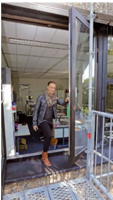
Inspektion der Bauarbeiten

richtszeit durchgeführt werden. Die Beendigung der Arbeiten soll, je nach Witterungseinbruch, bis Ende 2015 erfolgen.