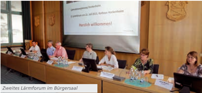
Zweites Lärmforum im Bürgersaal

Nach über zwei Jahren lud das Regierungspräsidium Karlsruhe am 30. Juni zum Erörterungstermin für die Planfeststellung zur Verbesserung des Schallschutzes in Hockenheim in die Stadthalle ein.