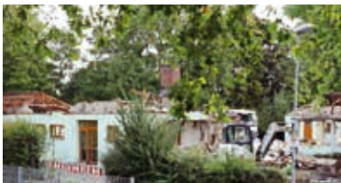
Abriss des alten St. Josef Kindergartens

Das Ende der Schulferien brachte aber einige neue Entwicklungen mit sich. Diese begannen im September mit dem Abriss des Kindergartens St. Josef. Es war der erste Schritt für umfangreiche Veränderungen im Schulzentrum.