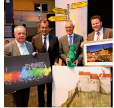
Übergabe des „Einheitsmännchens“

mit viel Leben gefüllt wurde. „Die Ziele von 1976 sind heute noch so aktuell wie damals“, meinte sie. Dies zeigte sich 2015 auch bei Begegnungen und Aktivitäten des Freundeskreises Hockenheim-Commercy, des Kunstvereins, des ASG Triathlon Hockenheim, des FV 08, des Gauß-Gymnasiums sowie der Angelsport- und Schützenvereine.