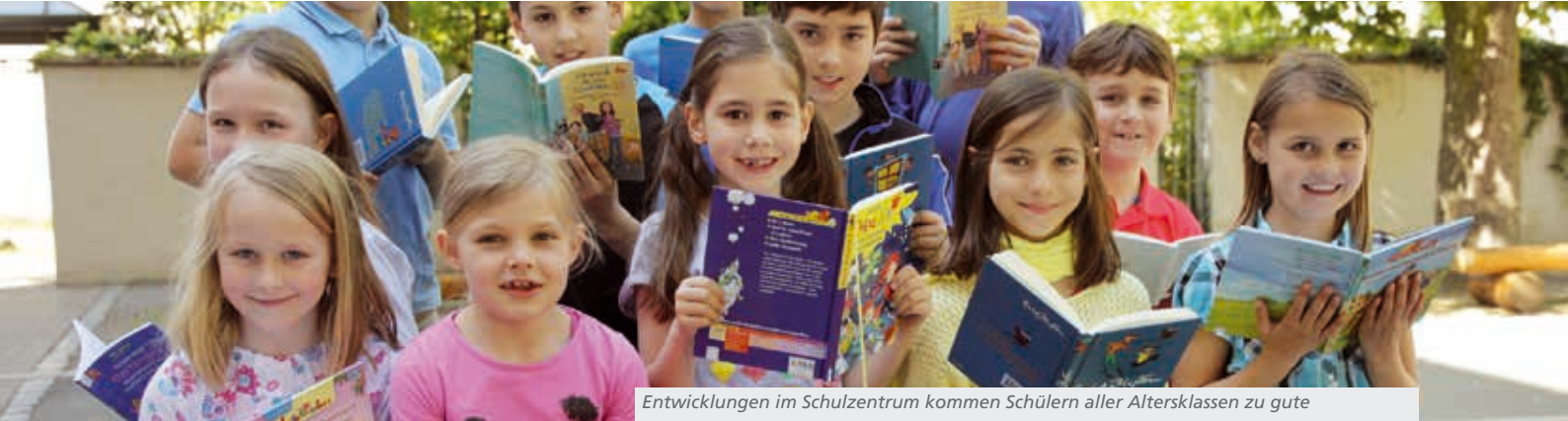
Entwicklungen im Schulzentrum kommen Schülern aller Altersklassen zu gute

Mit dem Startschuss ins neue Schuljahr kam nach den Sommerferien wieder Leben in das Schulzentrum von Hockenheim. Auch die Kinder wurden von ihren Eltern wieder in die Kindergärten gebracht.