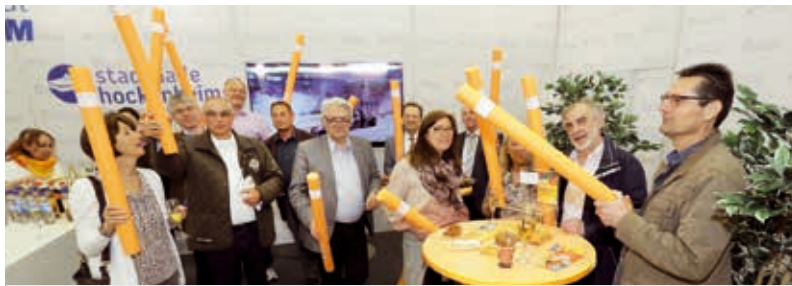
Gemeinderäte mit Schwimnudeln auf dem Maimarkt