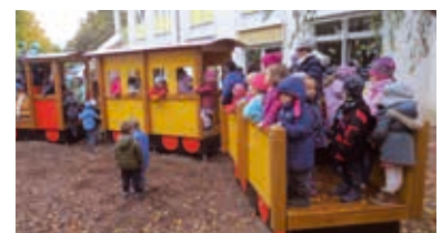
Spiel und Spaß mit der neuen EMMA

Auch die anderen städtischen Kindergärten in Hockenheim haben im Jahr 2015 viel unternommen. Der Park-Kindergarten brachte bei der Aktion „Der Lack ist ab“ mit Kindern und Eltern seinen Spielplatz wieder „in Schuss“ oder veranstaltete einen Sommer-Flohmarkt im Gartenschau-park. Der Friedrich-Fröbel-Kindergarten bot das erste Mal einen „Eltern-Kind-Waldtag“ an. Außerdem weihten die Erzieherinnen mit den Kindern Anfang November die neue Spiel-Eisenbahn EMMA im Kindergarten ein.