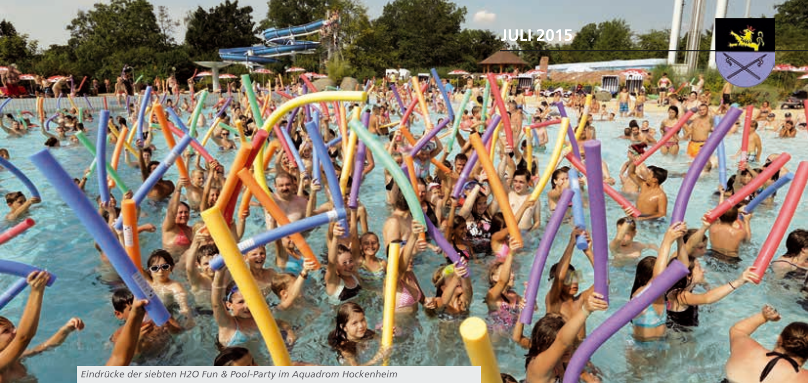
Eindrücke der siebten H2O Fun & Pool-Party im Aquadrom Hockenheim