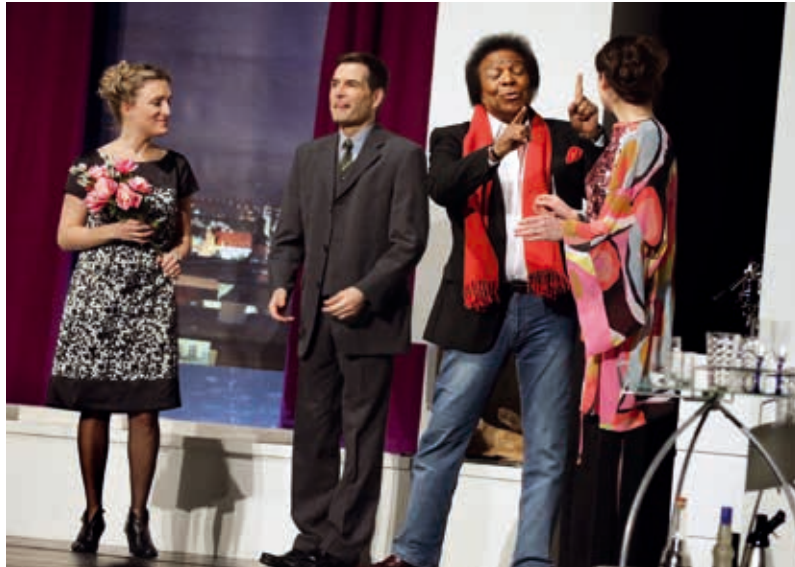
Roberto Blanco (2. v. r.) in „Der Mustergatte“

Nicht nur auf der Halle, sondern auch im Gebäude wurde kräftig gewerkelt. In fünf Monaten (Juli – November) wurden weitere 130.000 Euro investiert. So wurde die „Kleinkälte“, also die Versorgung der Kühlräume des Restaurants Rondeau, instand gesetzt, um damit die gastronomische Verpflegung