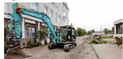
Die Abfahrt Messplatz von der Karlsruher Straße: Zeitweise wegen Bauarbeiten gesperrt

umfasst mehrere Elemente. Ab Mitte 2016 werden auf einer Gesamtfläche von 4.820 Quadratmeter Gebäude mit Familien- und Seniorenwohnungen und Gewerbeflächen gebaut sowie die Lücke an der Karlsruher Straße 19 geschlossen. Das vorherige Investoren- und Architektenauswahlverfahren der Stadt für dieses Vorhaben gewann die Firma Conceptaplan/Architekturbüro Bilger-Fellmuth.