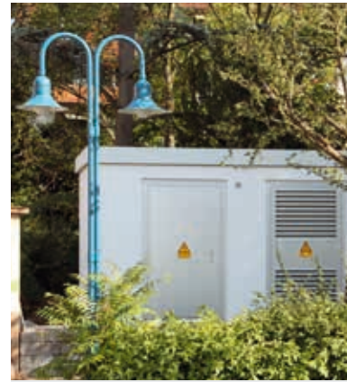
Neue Station liefert Energie

Der Energieversorger nahm 2015 eine neue Trafo-Station in Betrieb.