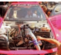
Public Race Days

„Rock or Bust“ war bereits im Mai das Motto als AC/DC die Luft am Ring brennen ließ. 105.000 Fans waren an die Rennstrecke gekommen, um mit den australischen Hardrock-Giganten um Brian Johnson und Angus Young, die mit Songs wie „Highway To Hell“ eine ganze Generation prägten, eine ihrer raren, innerhalb weniger Minuten ausverkauften Deutschland-Shows zu feiern. Auch das Festival „Rock'n'Heim“ fand erneut im August statt.