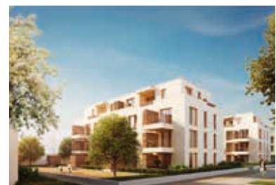
Neue Wohngebäude auf dem Messplatz

Der Messplatz als „Filetstück“ der Innenstadt ist ein zentraler Bestandteil für die nachhaltige Entwicklung Hockenhaims. Seine Neugestaltung