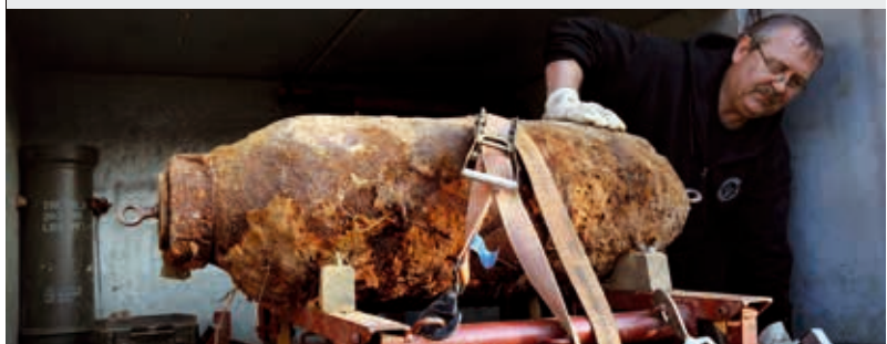
Mahnende Erinnerung: Die Fliegerbombe

Der Kampfmittelräumdienst gab aber schnell Entwarnung: Die Bombe konnte unproblematisch entschärft werden.